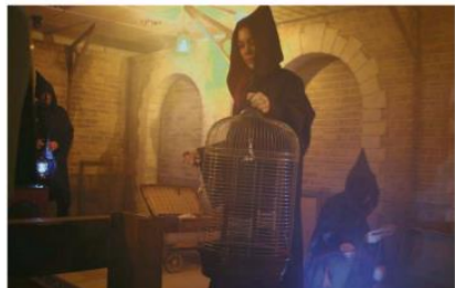
Décor météorite dans l'une des huit salles de l'escape game Time Break, qui a ouvert ses portes au Côté de la Défense. Le conseil pour le jeu